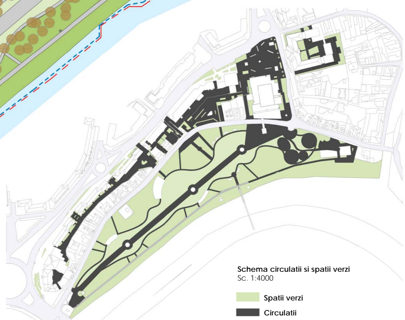
Schema circulatii si spatii verzi Sc. 1:4000 ■ Spatii verzi ■ Circulatii