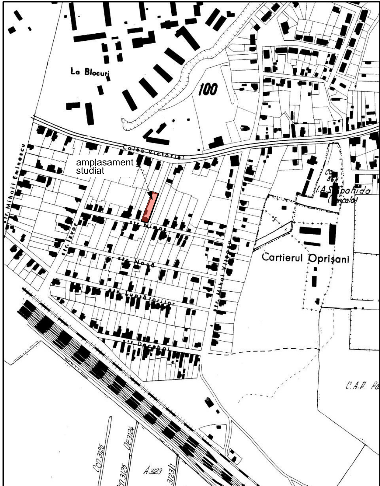
Plan de încadrare în zonă Scara 1:5000