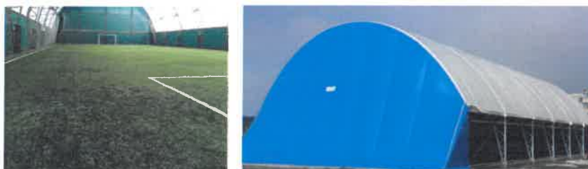
Figure 1 Aspect si Marcaje teren de fotbal